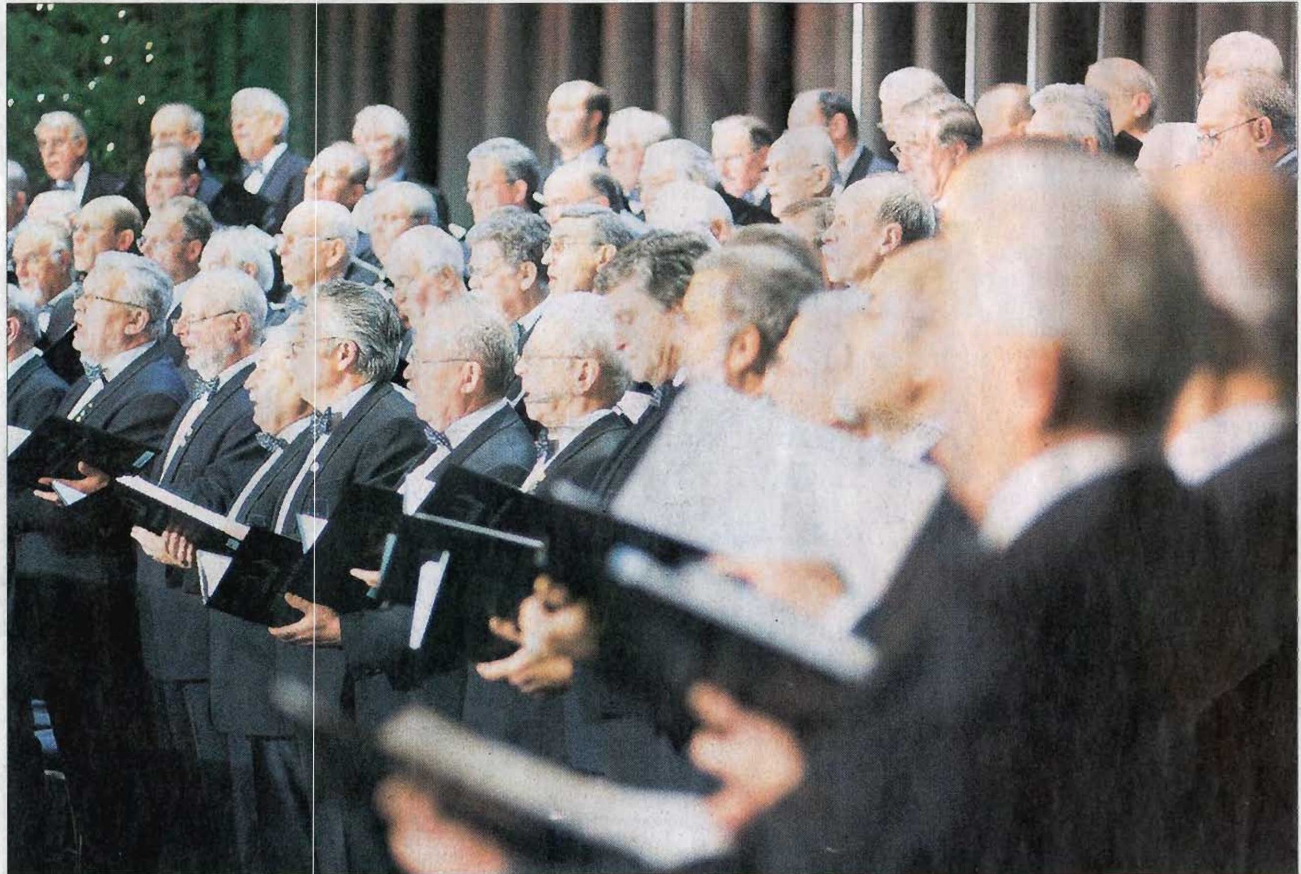
Mit Liedern aus Deutschland, den USA und Italien begeisterten die Sänger des Deutz-Chors die Zuhörer im Gürzenich.